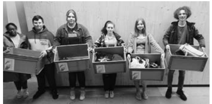
Bild: Lerngruppensprecher mit Spendenkisten am Standort Rosenfeld

In der letzten SMV-Sitzung haben die Lerngruppensprecherinnen und -sprecher überlegt, wie sie den Betroffenen des Ukraine-Kriegs helfen können. Dabei sind sie auf die Idee gekommen, eine schulinterne Sammelaktion für Sportbekleidung durchzuführen, um zu uns geflüchteten Kindern die Teilnahme am Sportunterricht zu ermöglichen. Diese sollen nach ihrer Flucht so gut es geht in einen Alltag zurückfinden, und dazu gehört natürlich auch der Schulbesuch inklusive Sportunterricht – für den es aber eine entsprechende Ausrüstung benötigt. „Sport macht es uns möglich, Brücken zu bauen und Gemeinschaft zu schaffen, denn der Sport spricht alle Sprachen“ schrieb die SMV in ihrem Spendenaufruf an alle Schülerinnen und Schüler. Und so sammelten sie Trainingshosen, T-Shirts, Hallensportschuhe, Sporttaschen und Badebekleidung. Damit wurden inzwischen einige große Kisten gefüllt, was die Lerngruppensprecherinnen und -sprecher sehr freute.