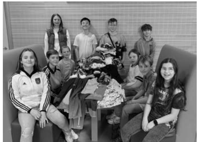
Bild: Lerngruppensprecher mit Spenden in Geislingen

Die Spenden werden jetzt erst einmal sortiert und gewaschen, um dann nach den Ferien verteilt zu werden. Die GMS Kleiner Heuberg bedankt sich herzlich bei allen Spenderinnen und Spendern.