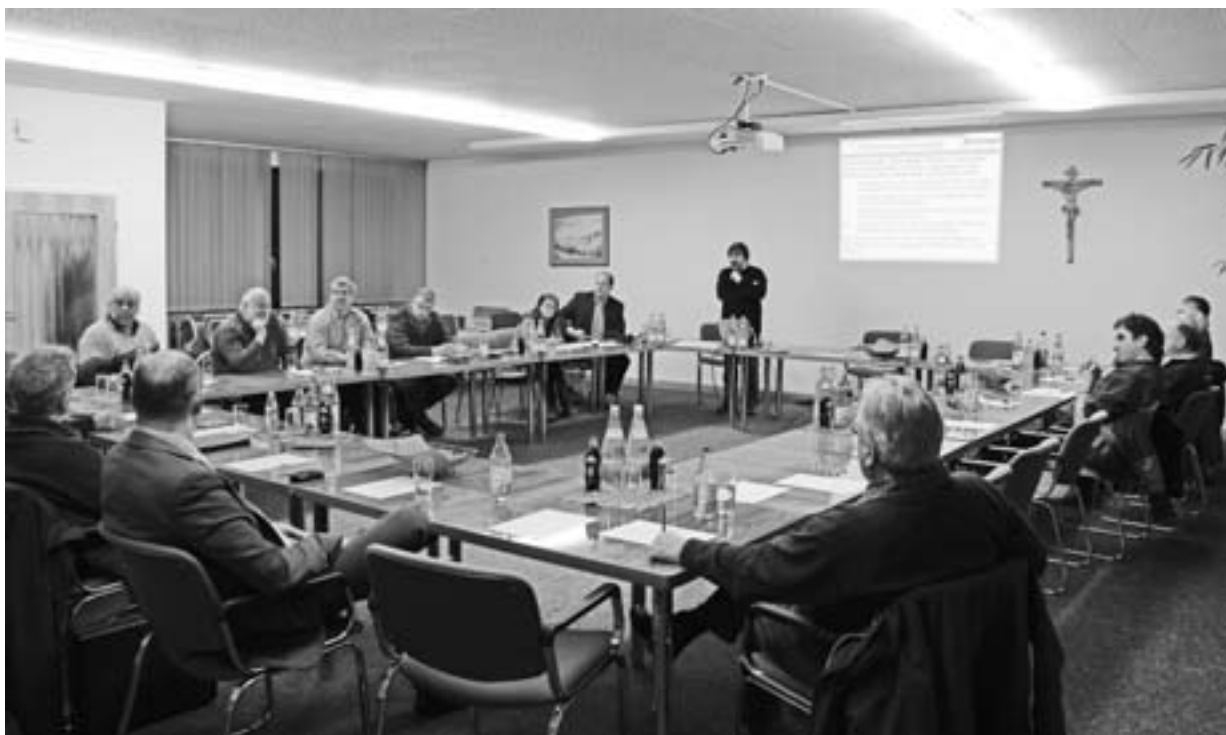
Workshop "Zusammenhalt bringt Klimaerhalt" am 26.2.2013

Je mehr Klimaschutz-Maßnahmen umgesetzt werden, umso mehr verändern sie das Leben in der Stadt. Doch wie bewahren wir uns unser bürgerschaftliches Gemeinschaftsgefühl, unser helfendes Umgehen miteinander? Wie können wir die Stadt moderner machen und doch zugleich unsere unverwechselbare Stadtkultur bewahren? Wie können wir den Umbau vorantreiben und doch das Soziale im Blick behalten? - Es geht um die Spannung zwischen Neuem und Altem, zwischen Tradition und Moderne. Das Projekt "Zusammenhalt bringt Klimaerhalt" soll helfen, einerseits eine Vorausschau der Veränderungen vorzunehmen und andererseits Werkzeuge für eine soziale Gestaltung des Wandels bereitzulegen.