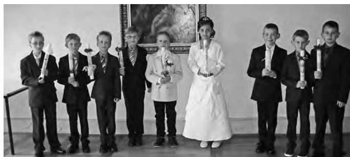
Kommunion in Binsdorf am 27.04.2014

Herzlichen Dank allen, die bei der Vorbereitung und Gestaltung der Erstkommunion dabei waren!