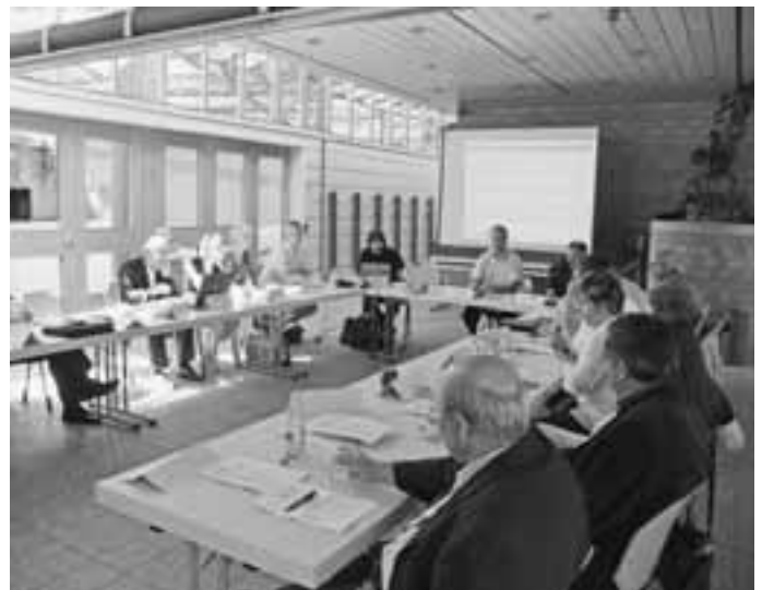
Der „Kleine Handwerksgipfel“ von Geislingen am 05.07.2010 in der Schlossparkhalle