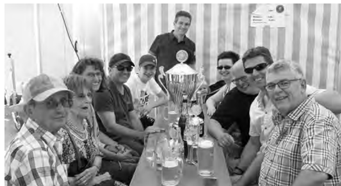
Mitglieder des Schalke Fanclubs