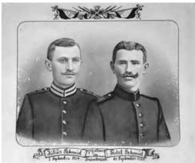
Alfons Koch Stadtarchiv Geislingen

Falls ausreichend Fotografien und/oder schriftliche Dokumente zusammenkommen, kann eine Ausstellung mit Vortrag erarbeitet werden.