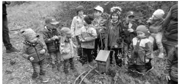
Am Grillplatz angekommen verweilen alle Familien noch gemütlich am Lagerfeuer.