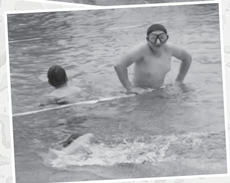
Das Team der Rettungsschwimmer freut sich auf die diesjährige Freibad-saison.