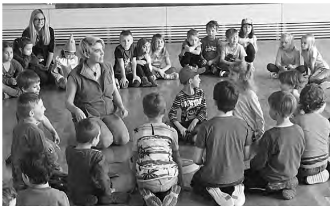
Ich bin Klasse, so wie ich bin..