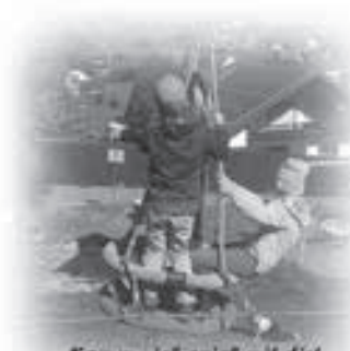
Komun - ick spiel mit dir!