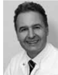
Prof. Dr. Löwenheim

Das Risiko zur Entwicklung einer Demenz ist bei hochgradiger Schwerhörigkeit bis zu fünfmal erhöht.