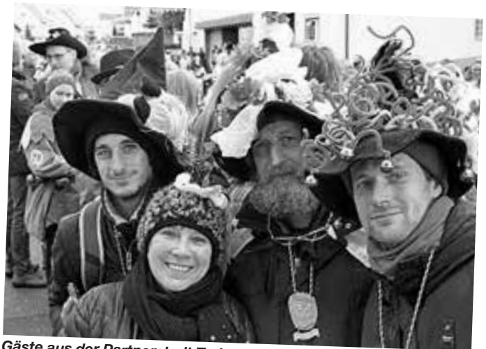
Gäste aus der Partnerstadt Treiso