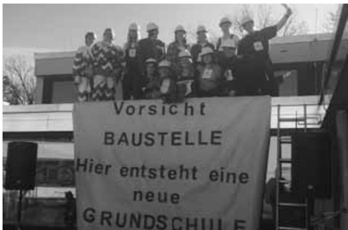
Passend zu den anstehenden Sanierungsarbeiten verkleidete sich das Lehrerkollegium am "Schmutzigen" Donnerstag als Bauarbeiter.

Auch die Verwaltung der Grundschule ist während der Sanierungs- und Erweiterungsarbeiten im Schloss untergebracht und wie folgt erreichbar: Telefon: (07433) 386928-4, Fax: (07433) 386928-6, E-Mail: gsgei@stadt-geislingen.de