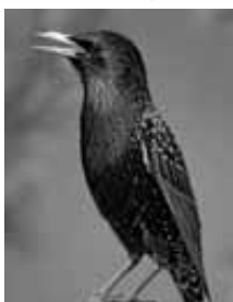
zum Bild: Wo sind unsere Frühlingsboten, die Stare?? Kaum einer ist zu sehen.

Alle Jäger aus Erlaheim, Binsdorf und Geislingen sollten anwesend sein, da Neuwahlen durchgeführt werden.