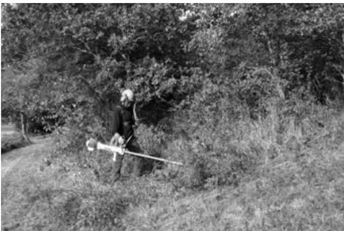
Mit dem Freischneider wird das Gestrüpp beseitigt; Fotografie: Regierungspräsidium Tübingen.

Das Regierungspräsidium Tübingen informiert über den Einsatz des Landschaftspflegetrupps im Naturschutzgebiet „Eichberg“. Die geplanten Landschaftspflegemaßnahmen wurden am 6. April 2016 vorgestellt. Eine erste Demonstration der vorgesehenen Arbeiten fand am 2. Oktober im Rahmen des Landschaftspflegetags in Erlaheim statt. Nun steht der vorgesehene Einsatz des Landschaftspflegetrupps des Regierungspräsidiums an. In den nächsten Wochen werden die ehemaligen Streuobstwiesen wieder in Stand gesetzt.