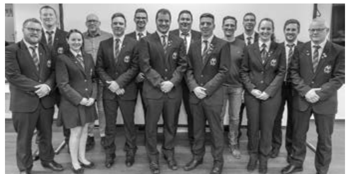
Der Ausschuss des Musikvereins.

Wir bedanken und bei allen ausscheidenden Vorstands- und Ausschussmitgliedern für ihr jahrelanges Engagement.