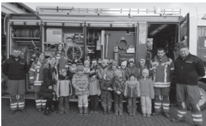
Ein Gruppenfoto zur Erinnerung

Wir möchten uns an dieser Stelle bei der Feuerwehr Geislingen und besonders an unsere 5 Betreuer bedanken: für den spannenden Vormittag und dafür, dass wir immer kommen können.