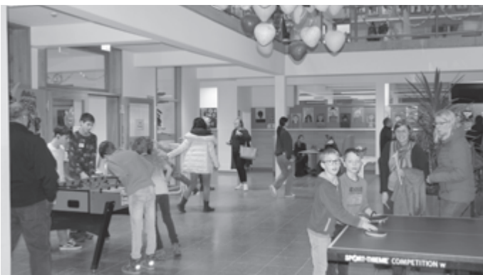
Das Foto zeigt ein buntes Treiben beim letztjährigen Tag der offenen Tür im Geislinger Schulhaus.

In diesem Jahr öffnet das GMS-Team am Mittwoch, 7. Februar 2024 von 16.30 bis 19.00 Uhr ihre Türen in Geislingen für zukünftige Fünftklässler, ihre Familien und alle Interessierten. Diese können sich in den Lernbüros und Fachräumen ein umfassendes Bild über das Schulkonzept, Lehr- und Lernmittel, Mittagspausenangebote, Lernpaketarbeit etc. machen. Neben verschiedenen Mitmachangeboten besteht die Möglichkeit, mit SchülerInnen, Eltern und Lehrkräften ins Gespräch zu kommen. Um 17.00 Uhr gibt es außerdem einen kurzen Infoblock der Schulleitung. Für Bewirtung ist gesorgt. Das Team der GMS Kleiner Heuberg freut sich auf viele kleine und große Besucher und lädt herzlich zu diesem informativen Nachmittag ein!