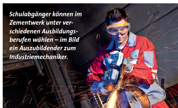
Schulabgänger können im Zementwerk unter verschiedenen Ausbildungsberufen wählen – im Bild ein Auszubildender zum Industriemechaniker.