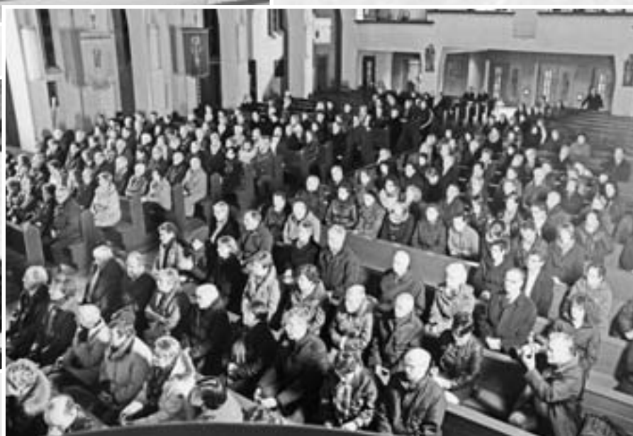
Bilder: Oliver Juriatti