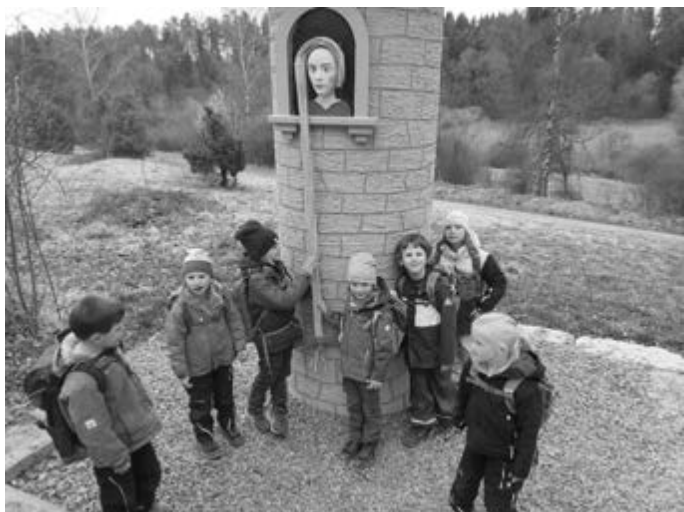
Schlafen und Ruhen bei den Sonnenkindern