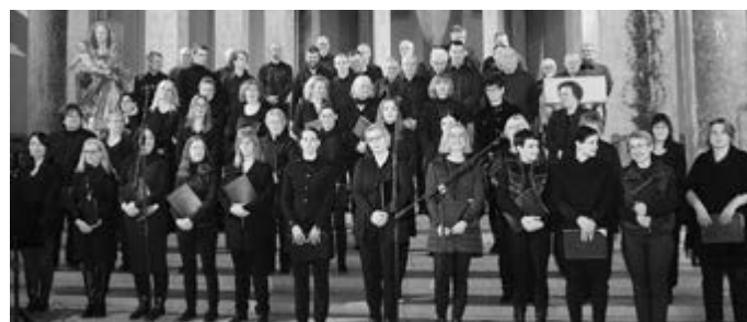
Im Bild: Der gemischte Chor des Gesangvereins Eintracht Geislingen

Mit der "Musikalischen Einstimmung in die Karwoche" hat der Gesangverein Eintracht Geislingen am Abend des Palmsonntag alle Erwartungen übertroffen. In der sehr gut besetzten St. Ulrichskirche herrschte über die gesamte Dauer des Auftritts eine sowohl gespannte als auch andächtige Stimmung, denn die Darbietenden verstanden es hervorragend, Musik und Texte zu einem berührenden Gesamterlebnis für die Zuhörerinnen und Zuhörer werden zu lassen.