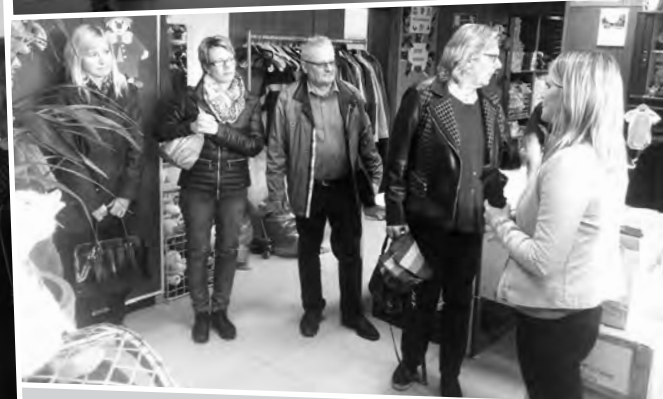
Bilder: Steve Mall, Jacqueline Mayer