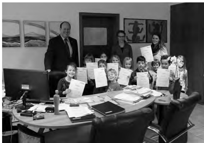
Im Büro des Bürgermeisters gefiel es den Bärenkindern sehr gut.

Dieser beantwortete gerne die Fragen der Kinder und erklärte kindgerecht, was zu den Aufgaben eines Bürgermeisters sowie der Stadtverwaltung gehört.