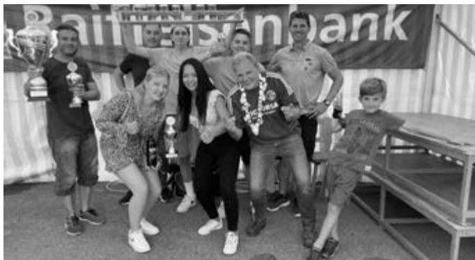
Eine Delegation der glücklichen Sieger

Zusätzlich platzierten wir den diesjährigen Schützenkönig !!! Herzlichen Dank an alle Beteiligte und Glückwunsch zu diesem tollen Erfolg !