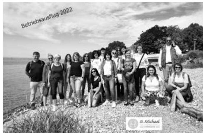
Ein wunderschöner Tag in Friedrichshafen am Bodensee.

Die Mitarbeiter der Seelsorgeeinheit "Am Kleinen Heuberg" konnten wieder nach der Coronazeit gemeinsam einen Ausflug machen. Auch für unser Team war es eine schöne Auszeit nach den anstrengenden Tagen, die hinter uns liegt.