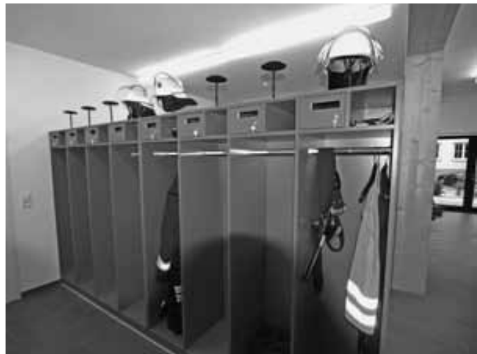
Derzeit noch leer: Die Spinde der Feuerwehrkameraden im Umkleideraum

Ansonsten habe er zum Glück keine bösen Überraschungen erleben müssen berichtete Walter. Er dankte in diesem Zusammenhang Bürgermeister Oliver Schmid für die große Unterstützung die er während der Bauphase von Seiten der Stadt Geislingen sowie den Gremien des Gemeinde- und Ortschaftsrats in allen Bereichen erfahren habe. „Ohne diese Unterstützung wäre dies so nicht möglich gewesen.“ Im September 2011 wurde innerhalb von 14 Tagen der Rohbau errichtet, pünktlich zum Wintereinbruch waren die Räumlichkeiten geschlossen, sodass der Innenausbau in dieser Zeit vorangetrieben werden konnte.