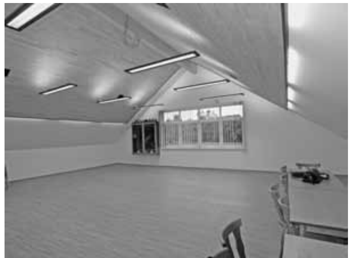
Der künftige Schulungs- und Aufenthaltsraum im Dachgeschoss

Abteilungskommandant Gerhard Walter blickt auf eine 1 1/2 jährige Bauzeit zurück. Die Planungen begannen bereits mit Aufstellung des Feuerwehr-Bedarfsplanes 2008, konkrete Planungen wurden in 2009/2010 erstellt und mit dem Feuerwehrhaus in Bambergen/Überlingen war ein Gebäude gefunden, das als Modell zugrunde gelegt werden konnte. Schnell war klar, ein Neubau war finanziell nur durch die Errichtung in Eigenleistung möglich. Die Feuerwehrkameraden waren bereit, diesen großen Kraftakt auf sich zu nehmen. Am 26. März 2011 begannen mit dem Spatenstich die Baumaßnahmen.