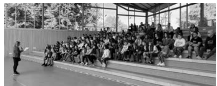
Foto: Frau Hausch begrüßt die Lerngruppen 6 und 7 in der Schlossparkhalle.

Mit einem ökumenischen Gottesdienst begann in Geislingen der erste Schultag nach den Sommerferien. Gemeinsam mit ihren Lehrerinnen und Lehrern versammelten sich die Schülerinnen und Schüler der Grundschule am Schlossgarten und der Stufen 6 und 7 der Gemeinschaftsschule in der St. Ulrichs-Kirche, um mit Gottes Segen ins neue Schuljahr zu starten. Anschließend pilgerten