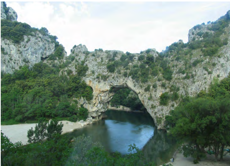
Die berühmte Pont d'Arc bei Ruoms ist eine natürliche Steinbrücke über den Fluss Ardèche.

Information: Die Städte Geislingen und Ruoms pflegen seit 1999 eine herzliche Städtefreundschaft. Ruoms ist eine touristisch geprägte Gemeinde in Südfrankreich mit rund 2300 Einwohnern im französischen Département Ardèche. Die Höhlennachbildung von Pont-d'Arc bildet einen Teil benachbarten Chauvet-Höhle (Grotte Chauvet) in der Gemeinde Vallon-Pont-d'Arc nach, um die dortigen Höhlenmalereien einem breiten Publikum in einer möglichst authentischen Umgebung zeigen zu können, ohne die Originale zu gefährden. Diese Höhlennachbildung ist die größte der Welt. Die Investitionskosten betragen rund 55 Mio. Euro. Die Höhlennachbildung wurde im vergangenen Jahr im Beisein des Staatspräsidenten Francois Hollande eröffnet.