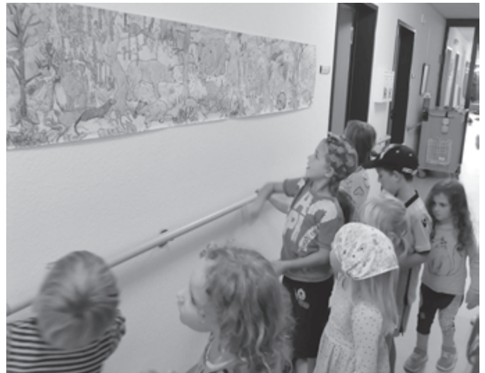
Die Kinder bewundern die Bilder der Senioren.

Bei unserem ersten Treffen wurden wir freudig erwartet. Die Kinder begrüßten die Bewohner ohne Scheu, sangen Lieder zur Herbstzeit und teilten Kastanien für ein gemeinsames Spiel aus. Nach einer leckeren Stärkung durften wir die selbstgemalten Bilder an den Wänden anschauen und eine Bewohnerin zeigte den Kindern sogar ihr eigenes Zimmer. Die Zeit verging wie im Fluge und wir wurden herzlich verabschiedet. Ein neuer Termin steht schon und wir freuen uns sehr darauf.