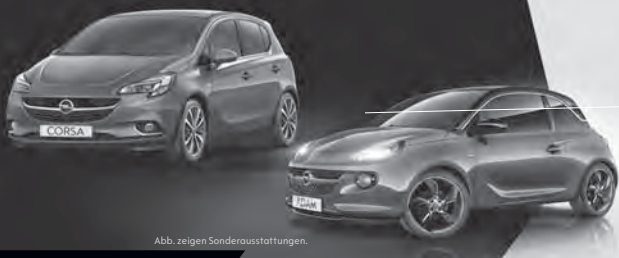
Abb. zeigen Sonderausstattungen.