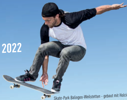
Skate-Park Balingen-Weilstetten - gebaut mit Holcim Zement