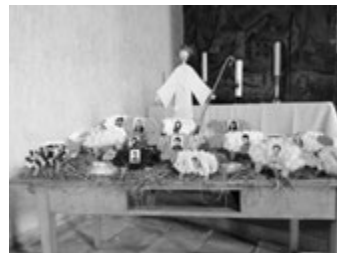
Collage von den EK-Kindern aus Geislingen

Elternabend abgesagt; Kennenlerntag abgesagt; Vorstellungsgottesdienst abgesagt: Die Erstkommunionvorbereitung in diesem Jahr startet alles andere als ideal. Und manche Sorge geht uns durch den Kopf, wie das alles noch werden wird.