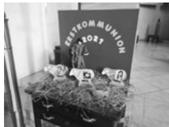
Collage von den EK-Kindern aus Binsdorf und Rosenfeld