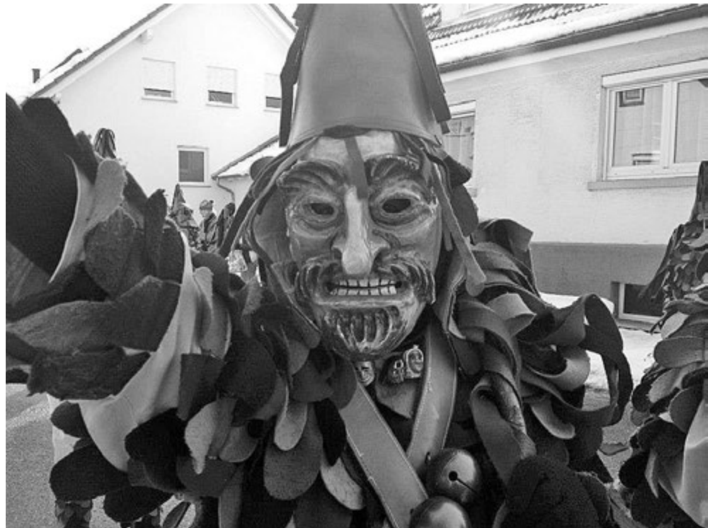
Die Narrenfigur Hex-Sauter der Narrenzunft Erlaheim e.V.

Der Narr verstummt nicht, ist nur etwas leise, macht Fasnet – mit Abstand – auf eine andere Weise.