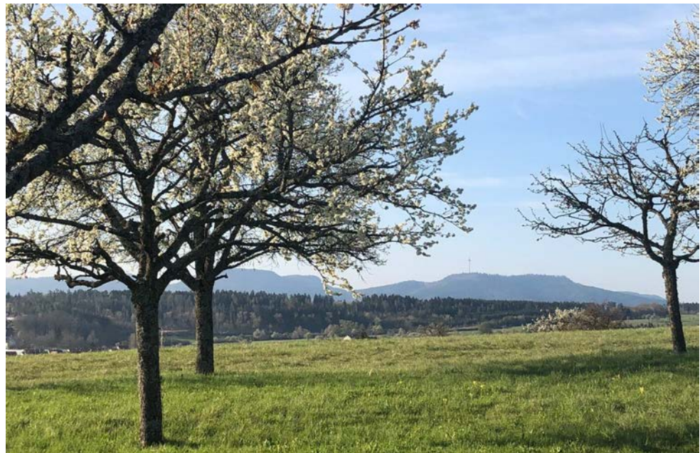
Blühende Obstbäume der Obstbauanlage der Gartenfreunde Geislingen ‚Im Wolf‘ mit Blick auf den Plettenberg.

Die Klimaschutzaktion „1.000 Bäume für 1.000 Kommunen“ des Gemeindetags Baden-Württemberg endet mit einem mehr als erfreulichen Ergebnis: Über zwei Millionen Bäume haben die Städte und Gemeinden landesweit gepflanzt. Damit wurde das angestrebte Ziel, im ganzen Land eine Million neue Bäume zu pflanzen von den Kommunen mehr als übertroffen.