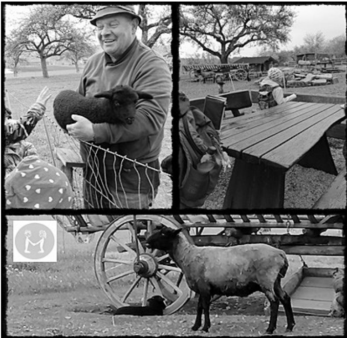
Auf dem Weg sammelten wir ganz viel Abfall ein.