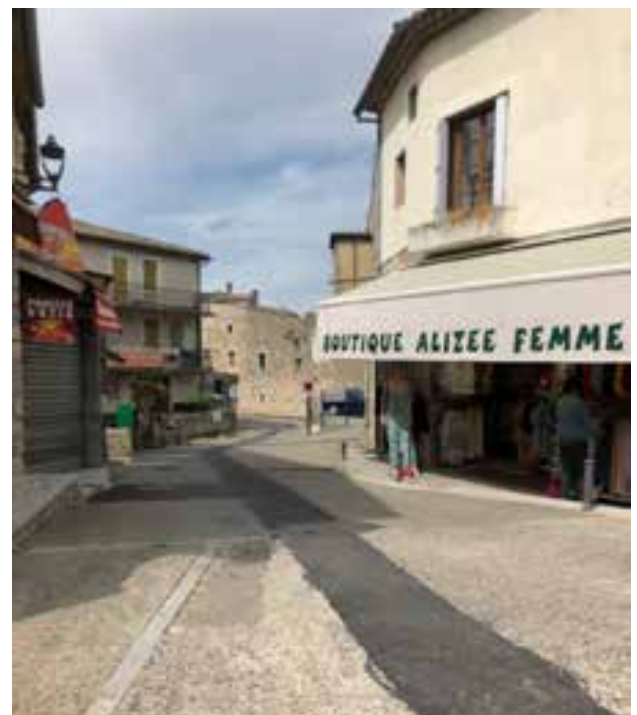
Verlassene Gassen in Ruoms, in denen sich sonst Touristen tummeln

Alle im Tourismus Tätigen erwarteten mit gewisser Besorgnis den Beginn des Monats Juni. In Ruoms hoffen alle, dass dann die Campingplätze, die Schwimmbäder und alle anderen Freizeiteinrichtungen wieder geöffnet werden können.