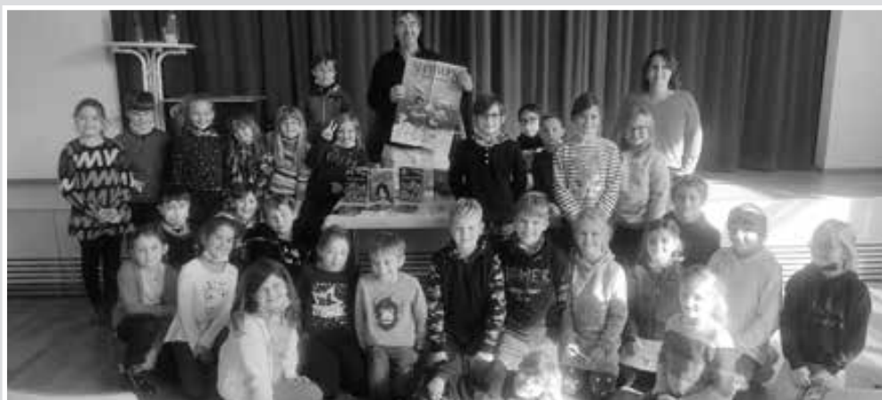
Text und Bilder: Stadtbücherei