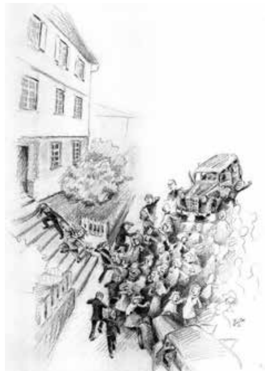
Der Aufstand der Geislinger Frauen 1941 Zeichnung: Uwe Amann (2011)

Daraufhin hatte also der Landrat den Leutnant der Gendarmerie mit einigen Gendarmen nach Geislingen geschickt, und dann die Außenstelle Oberndorf der Geheimen Staatspolizei verständigt. Bald darauf fuhr der Landrat selbst, in Begleitung des Kreisleiters, nach Geislingen. Sie erreichten den Ort, als die Gestapo gerade angekommen war. Sogleich wurde gegen die Frauen mit Gewalt vorgegangen. Sie wurden auseinandergetrieben, es wurde auf sie eingeschlagen, Blut floss, die Frauen erhielten Tritte und Schläge. Auch vom Einsatz von Knüppeln wird berichtet. Es kam zu Verhaftungen; mindestens drei Frauen wurden festgenommen und acht Tage lang in Oberndorf in Gewahrsam gehalten mit der Begründung: Gebrauch beleidigender Ausdrücke. Es gibt weitere Hinweise auf Verhaftungen von 17 Frauen im Arrest in Balingen, weil sie damit gedroht hatten, ihre Männer aufzufordern, an der Front ihre Waffen wegzuworfen.