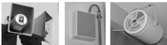
Die installierten Lautsprecher an der Schlossparkschule im Außenbereich (li.) in den Fluren (mi.) sowie in den einzelnen Klassenzimmern (re.)

Es war das größte Projekt, das die Mitarbeiter des städtischen Bauhofes, parallel zu den vielseitigen übrigen Aufgaben im Jahr 2012 stemmten: Unter der Leitung des städtischen Elektromeisters Egon Straubinger verlegten die städtischen Mitarbeiter rund 3.000 Meter Kabel und ca. 700 Meter Aluminiumrohre um die sich über 5 Gebäude erstreckende Anlage mit über 100 Lautsprechern und die insgesamt 23 Alarmierungsknopfen installieren zu können. Ebenfalls war die Installation von insgesamt 8 Verteilerschränken für diese Maßnahme notwendig.