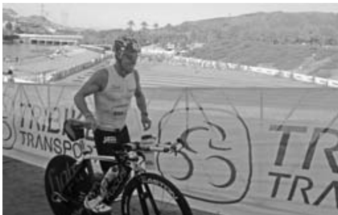
Gerade noch im Wasser, alsbald auf dem Rad - zu diesem Zeitpunkt war die Temperatur noch erträglich

Der Ausdauersportler war ursprünglich durch eine Bandscheiben-Operation zum Triathlon gelangt, indem er durch ergänzendes Schwimmen und Radfahren die Muskulatur stärken und die körperliche Belastung beim Sport verteilen wollte. Seither nimmt er jährlich an mehreren regionalen Wettkämpfen, darunter auch dem Geislinger Halbmarathon regelmäßig teil. Diese Strecke mutet bei vergleichsweise „lediglich“ 21,1 km dabei fast schon wie ein Trainingslauf an.