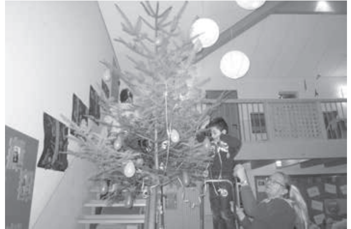
Schmücken unseres Narrenbaumes

Am Schmotzigen sind nachmittags wieder Jung und Alt zum bunten Treiben in unsere Halle eingeladen!