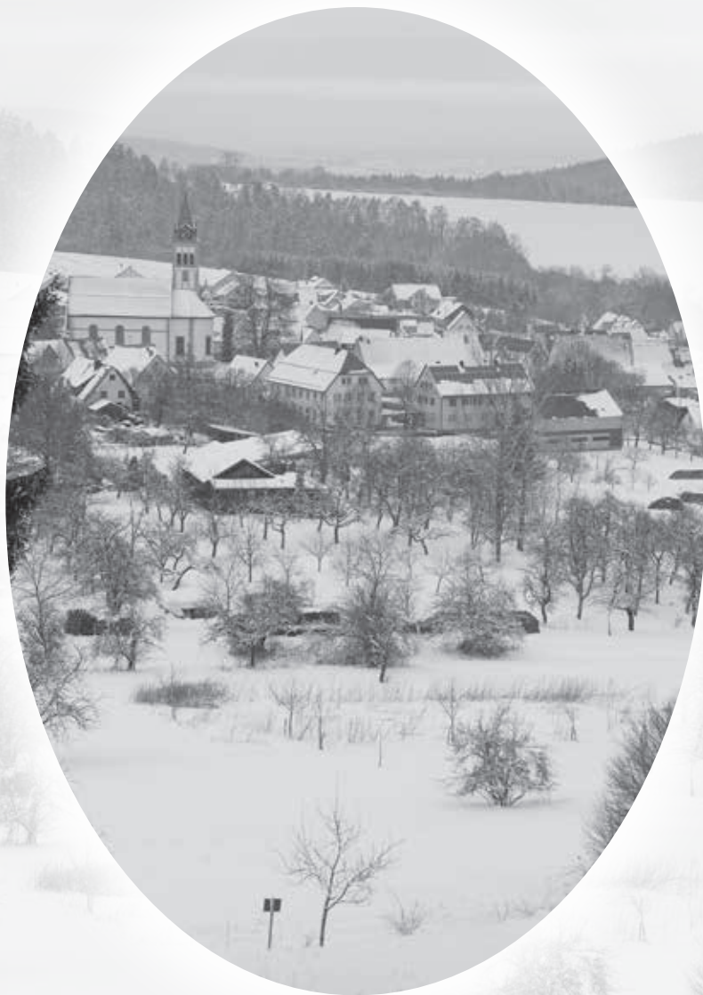
Blick vom Eichberg auf Erlaheim.

...und verleiht der Natur ihren jahreszeitlich bedingten Charme. Einher mit der winterlichen Romantik geht auch die Verpflichtung zum Räumen und Streuen der Geh- und Fußwege.