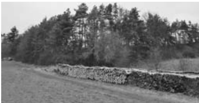
Blick auf den Bereich, in dem die Pflegemaßnahme durchgeführt wird.

In diesem Zug werden auch einzelne Heckenbereiche des Friedhofes Geislingen, sowie im Eingangsbereich des Friedhofes Erlaheim auf Stock gesetzt. Dies bedeutet, dass die Hecken bis auf eine Handbreit über dem Boden zurückgeschnitten werden, um sie wieder zu verjüngen.