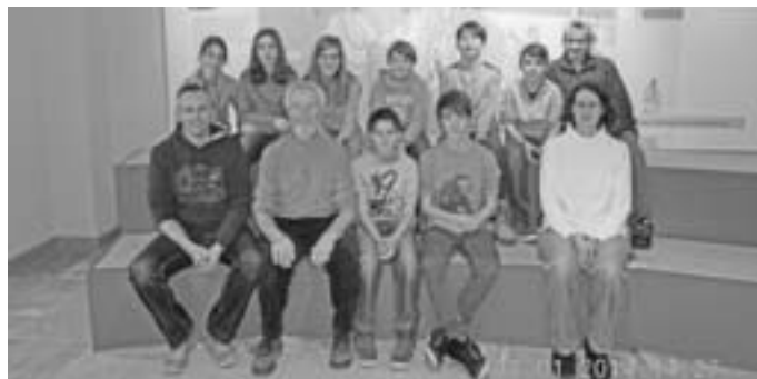
Im römischen Theater

Ein kurzer Besuch galt noch der Sammlung Dursch im Museum, in der auch einige Heiligenfiguren aus Geislingen und Umgebung ausgestellt sind. Die Heimreise verlief auch völlig unproblematisch und so waren Jung und Alt sehr angetan von diesem lehrreichen Ausflug.