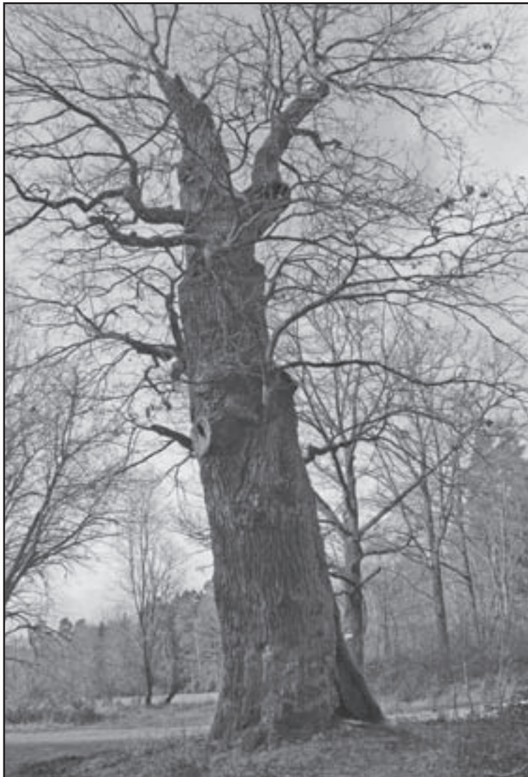
Das Naturdenkmal Erlaheimer Eiche im Januar 2014

„Wenn es nicht wintert, sommert es auch nicht.“