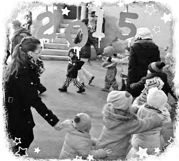
Jo i bee an waschechter Geislinger

Die Kinder des Kindergarten St. Michael haben das Schloss in ein buntes Meer aus Farben verwandelt. Viele kleine und große Narren tanzten im und um das Schloss herum zu den Klängen der Fasnetsmusik. Es lebe mit Narri ei ei die spandalusische Narretei ... Vielen Dank an die Helfer in der Elternbar, an die Gartenfreunde, die Vogelfreunde und an die Narrenzunft Geislingen.