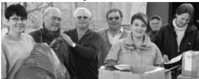
Mitglieder des Vereins beim Beladen eines Containers