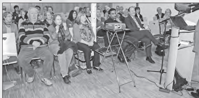
Rund 50 Besucherinnen und Besucher zeigten Interesse an diesem wichtigen Thema.