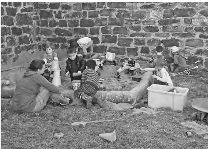
Sandspiele im Wassergraben

Kinder haben ein Recht auf Spiel. Es ist ihre Art, sich auszudrücken und zu lernen.