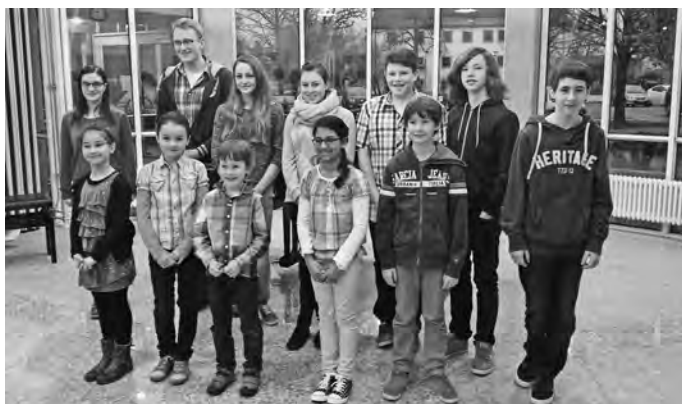
Einen tollen Konzernachmittag gestalteten die Klavierschülerinnen und -schüler der Jugendmusikschule Zollernalb e.V. im Foyer der Geislinger Schlossparkhalle.

Ein nicht alltägliches Instrument, eine Renaissancelaute, wurde dem Publikum zum Abschluss dieses gelungenen Abends präsentiert.