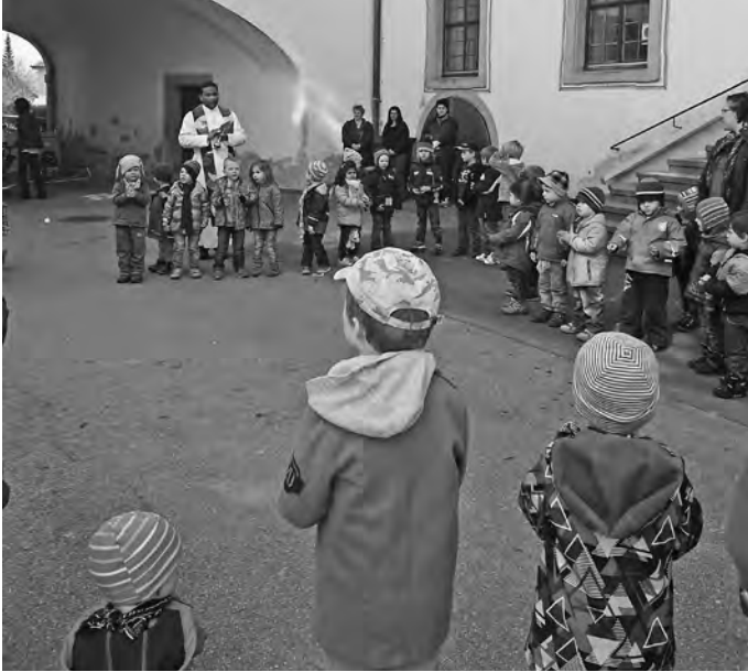
Mit Gottes Segen

Glaube, Hoffnung und Zuversicht - das Gefühl in Gottes Hand geborgen zu sein, gehört hier in St. Michael zu unserem Alltag, der die Kinder stärkt, ihnen Sicherheit vermittelt und jeden Tag die Zuversicht schenken soll, dass alles gut wird.