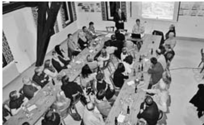
Rund 50 interessierte Bürgerinnen und Bürger waren bei der Gründungsversammlung anwesend.

z. B. der Sicherstellung der Grundversorgung, der Kinderbetreuung und der Vorhaltung von Bildungseinrichtungen, wird auch der Bereich Kunst und Kultur immer mehr zu einem „weichen“ und dennoch wichtigen Standortfaktor. Der ländliche Raum weist hier jedoch erhebliche Defizite aus. Das kulturelle Leben spielt sich immer mehr in größeren Städten und Gemeinden ab. Letztlich wirkt sich diese Entwicklung nachteilig auf den ländlichen Raum aus, erklärte Schmid.