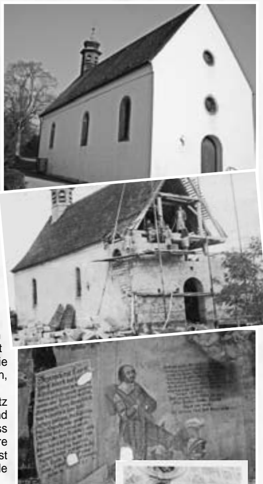
Geislingen Westportal Friedhofskapelle (Aufn. 1957) Foto: LOA Tübingen

(Quelle: Dokumentation Kleindenkmale Geislingen: Alfons Koch, Bernhard Bosch)