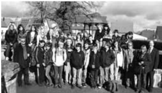
Die Besuchergruppe vor den Toren des Gartens von Schloss Geislingen

Nach einem kurzen Blick in's Schlossparkbad ging es weiter zur Schlossparkschule, wo die Führung endete. Magisch anziehend wirkte die dort installierte Kletterwand, auf die Schüler, die diese sogleich ausprobierten.