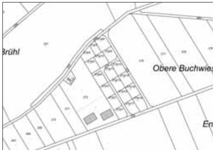
Schuppenggebiet „Obere Buchwiesen“, Binsdorf

In der Sitzung vom 16.09.2008 hatte der Gemeinderat der Stadt Geislingen für das Schuppenggebiet „Obere Buchwiesen“ einen vorläufigen Preis in Höhe von 15,50 € pro m 2 und für „Lau“ einen vorläufigen Preis in Höhe von 19,50 € pro m 2 beschlossen.