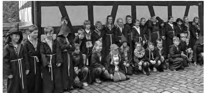
EK Ausflug 1

Auf dem Schlossplatz in Geislingen trafen sich die Erstkommunikanten der gesamten SE zum Erstkommunionausflug. Mit dem Bus ging es nach Bebenhausen. Das ehemalige Zisterzienserkloster mit dem Kreuzgang, der zu den bedeutendsten spätgotischen Anlagen dieser Art in Süddeutschland zählt, wurde interessiert besichtigt. Ein Vesper in der Klosteranlage stärkte die Wissenshungrigen, bevor sie sich auf der Spielwiese mit Fußball und diversen Spielen austoben konnten. Weiter ging es nach Rottenburg. Mit einem Lied und Gebet bedankte und verabschiedete sich die Gruppe im Dom St. Martin und trat frohgelaunt die Heimreise an.