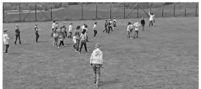
EK Ausflug 3