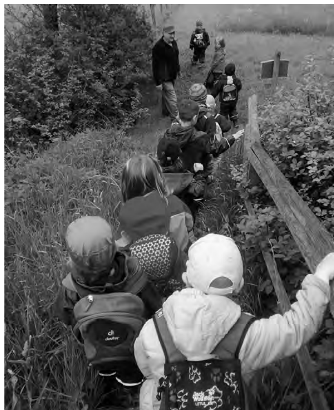
Auf dem Weg ins Abenteuer

Projekt der Hasenkinder (4- bis 5-Jährigen) mit Steuobstpädagogin Siegfried Schlaich - Erstellen eines Waldinsektenhaus