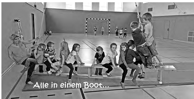
Alle in einem Boot...

Bewegungspiraten - Wir sind in Bewegung! Aktuelles finden Sie auf unserer Homepage: auch kurzfristige Terminänderungen www.kirche-geislingen.de/Kindergarten