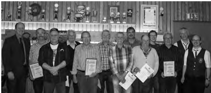
Im Foto die Jubilare und Geehrten des Schützenvereins

Liebe Bürgerinnen und Bürger der Stadt Geislingen, werte Vorstandskollegen,