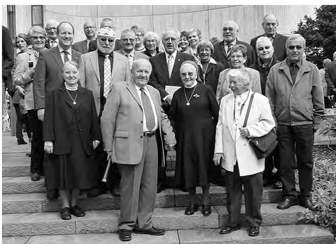
Eine große Geislinger Gästeschar war gekommen.

Nach dem Gottesdienst folgte das Festtagsmenü und am Nachmittag eine feierliche Vesper.