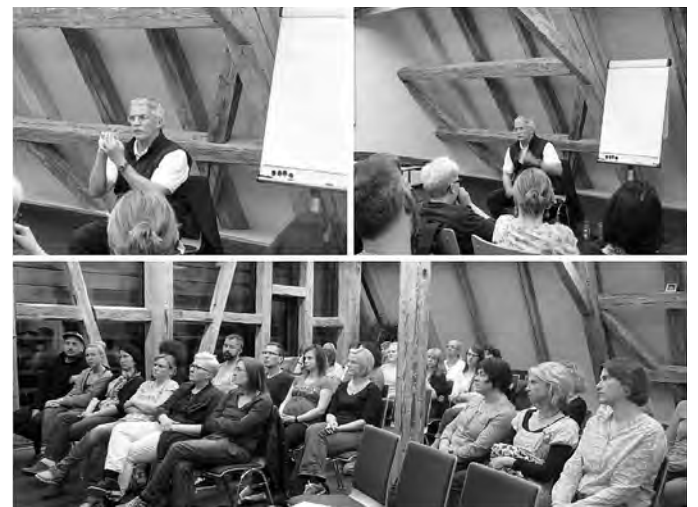
Impressionen vom Abend

"Eltern sollen sein...größer, stärker, weiser, und GÜTIG!"