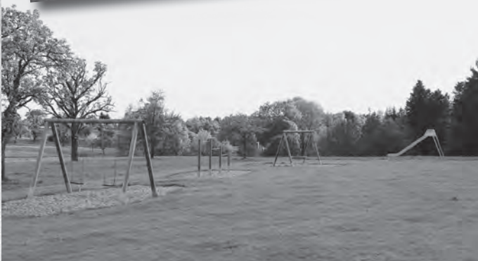
Der großzügige Grill- und Spielplatz sowie das dabei liegende Schützenhaus Ostdorf laden unterwegs zu einer längeren Rast ein.