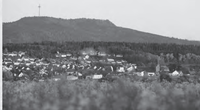
Beim Entlangwandern gibt der Oberholzweg einen herrlichen Blick auf das Albpanorama preis.