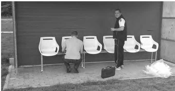
Die neue Ersatzbank der SpVgg.