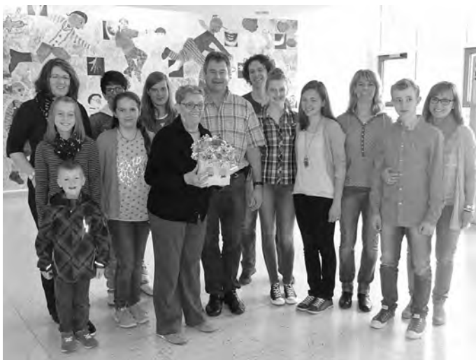
Spendenübergabe in Tübingen

Anschließend wurde noch das Elternhaus, welches ebenfalls vom Förderverein unterhalten wird, besichtigt. In diesem können die Eltern wohnen, solange die Kinder in der Klinik behandelt werden. Mit herzbewegenden, aber auch hoffnungsvollen Eindrücken etwas Gutes getan zu haben, traten die Sängerinnen und Sänger die Heimreise nach Geislingen wieder an.