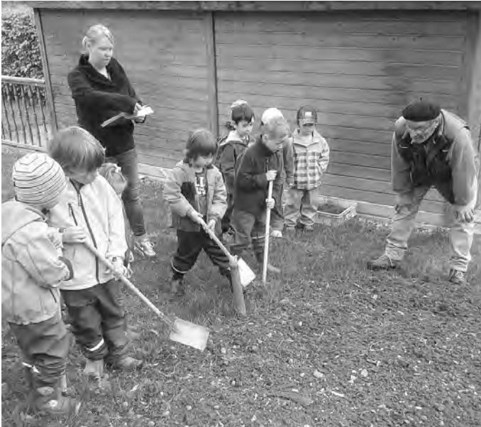
Der alte Kartoffelacker ....