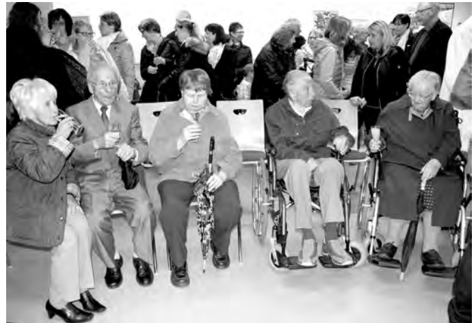
Beim Genießen des köstlichen Begrüßungstrunkes

Zur Einweihung des neuen Kindergartens St. Michael wurden die Bewohner vom St. Martin herzlich eingeladen. Die Feier fing mit einem Familiengottesdienst an, an dem wir gerne teilgenommen haben.