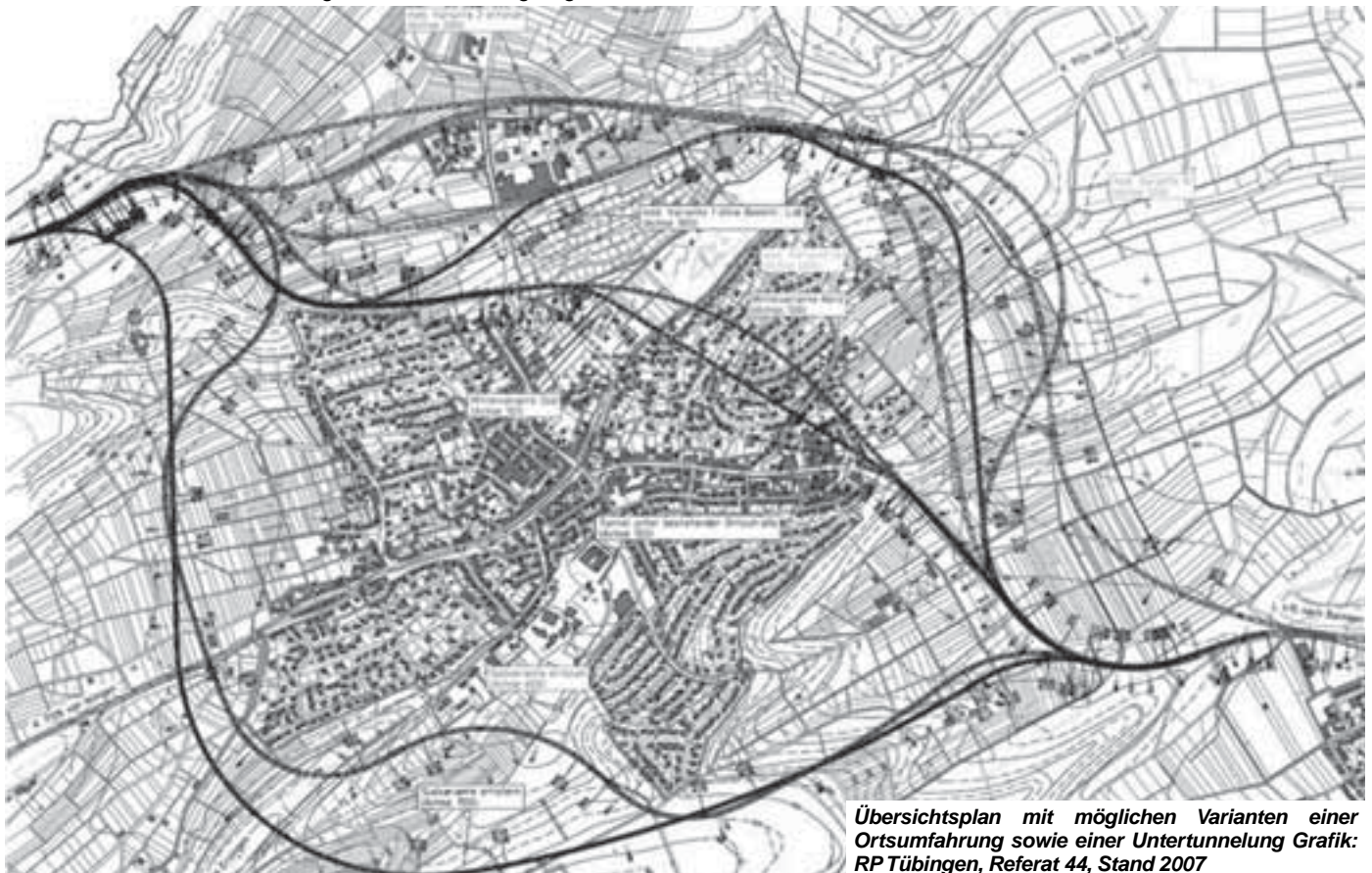
Übersichtsplan mit möglichen Varianten einer Ortsumfahrung sowie einer Untertunnelung Grafik: RP Tübingen, Referat 44, Stand 2007