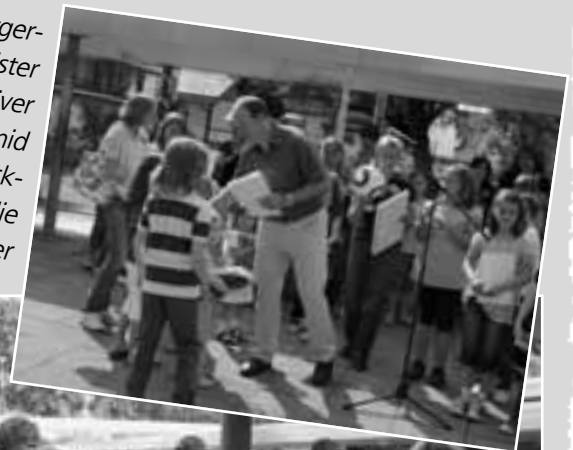
Bürgermeister Oliver Schmid beglückwünscht die Sieger