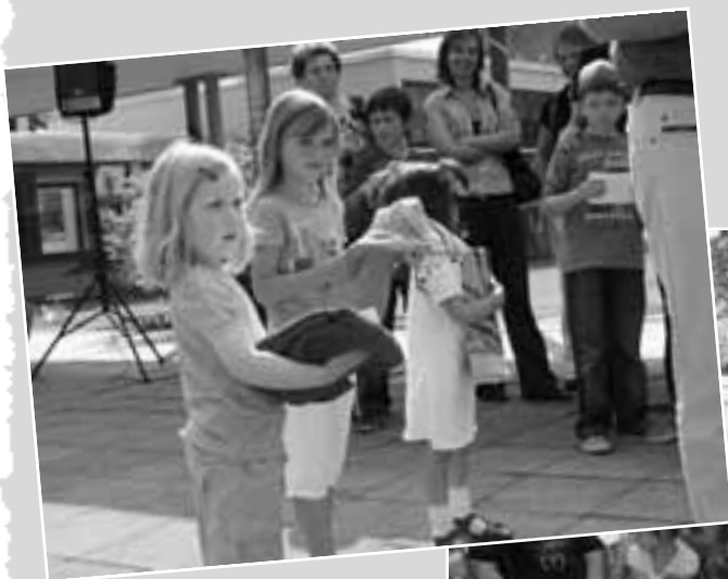
Kein Kind ging leer aus