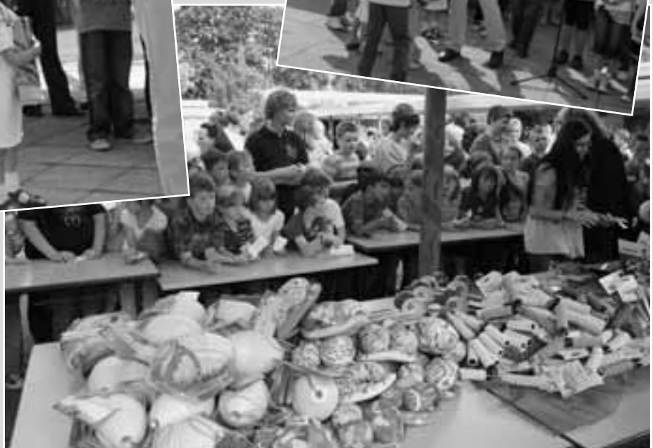
Der „Run“ auf die Trostpreise ging ohne Probleme vonstatten...