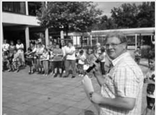
Der Ansturm auf die Trostpreise steht bevor