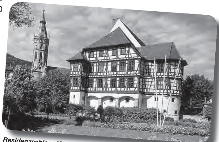
Residenzschloss Urach