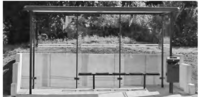
Das neue Buswartehäuschen an der Turmstraße in Geislingen-Binsdorf.

Das alte Buswartehäuschen an der Binsdorfer Ortsdurchfahrt konnte dieser Tage ersetzt werden. An dessen Stelle wurde ein neues Buswartehäuschen installiert. Der städtische Bauhof leistete dabei die Abtragungs- und Pflasterarbeiten, so dass die Wartenden nun wieder geschützt vor der Witterung den Service des Öffentlichen Personennahverkehrs (ÖPNV) in Anspruch nehmen können.