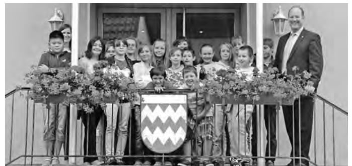
Die Klasse 5b der Gemeinschaftsschule vor wenigen Tagen vor dem Geislinger Rathaus, dem Sitz der Stadtverwaltung mit Bürgermeister Oliver Schmid

Diese und weitere Fragen beantwortete Bürgermeister Oliver Schmid gerne und stand Rede und Antwort zu allen Fragen. Anschließend begaben sich die SchülerInnen mit Bürgermeister Oliver Schmid auf den Weg durch das Rathaus um einen Einblick in die verschiedenen Aufgabenbereiche und Ämter zu bekommen. Als kleines Präsent erhielten alle noch Solartaschenlampen aus der „Klimastadt“. Mit diesen Eindrücken machten sich die Schüler wieder auf den Rückweg in die Schlossparkschule Geislingen.