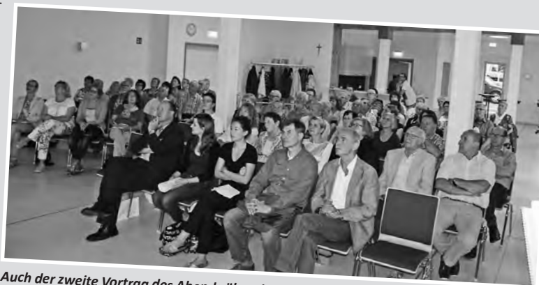
Auch der zweite Vortrag des Abends über die Restauration des Gemäldes...