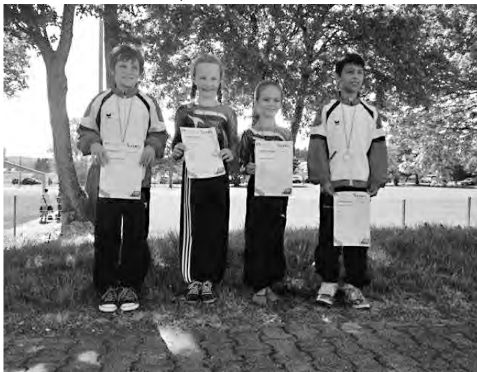
Die Sieger vom Gaukinderturnfest 2015