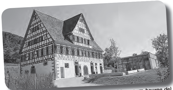
Freilichtmuseum Beuren

Die Teilnehmerzahl ist auf 50 Personen begrenzt. Die Stadt freut sich auf Interessierte aus allen Stadtteilen und bittet um Anmeldung beim Bürgerbüro auf dem Rathaus Geislingen, Tel.-Durchwahl 07433 / 96 84-19.