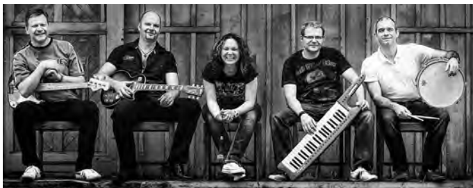
Chairs in The Alley

Für gute Stimmung sorgt die Band "Chairs In The Alley" mit Party Musik. Der Eintritt ist wie immer kostenlos.