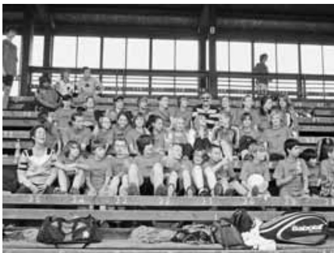
Bericht und Foto: privat

Die Mädchenmannschaft belegte den hervorragenden 3. Platz, die Jungen den 5. Platz.