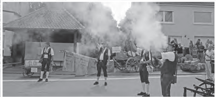
.. das durch die Böllergruppe des Schützenvereins Geislingen e.V. mit Böllerschüssen eröffnet wurde