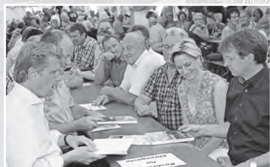
Auf großes Interesse stieß die Festschrift „Ein Blick in die Geschichte von Binsdorf“