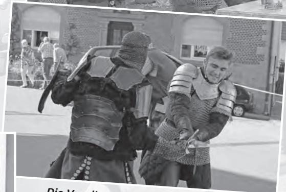
Die Vasallen von Hohenberg zogen mit deren Darbietungen nicht nur die kindlichen Zuschauer in ihren Bann