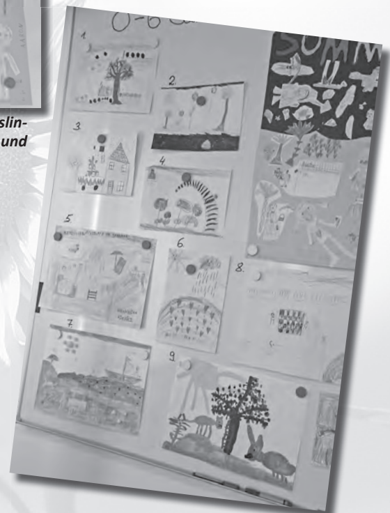
Die Redaktion des Amtsblattes durfte sich in den vergangenen Wochen über viele sehr schöne Einsendungen freuen.