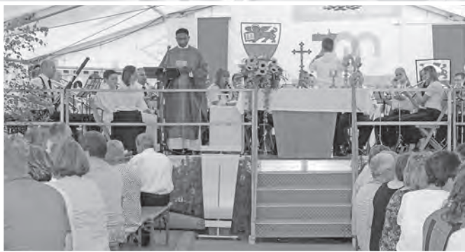
Am Sonntag früh fand ein Festgottesdienst im Zelt unter musikalischer Umrahmung durch den Musikverein Geislingen e.V. statt