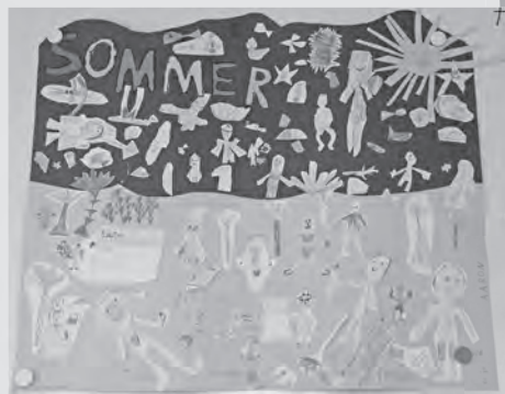
... und der Klasse 1b der Grundschule Geislingen wurden außer Konkurrenz bewertet und erhalten einen Sonderpreis