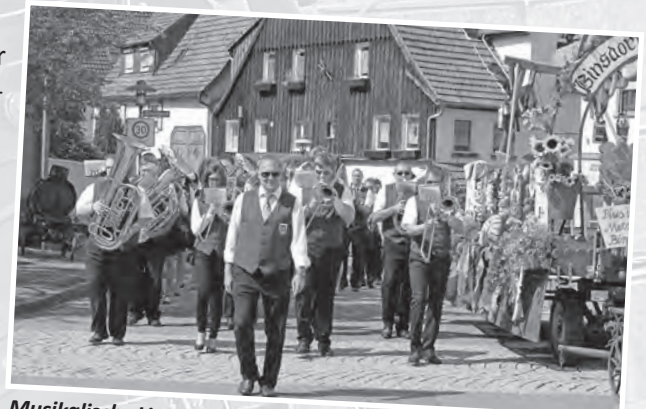
Musikalische Umrahmungen durch die Stadtkapelle Binsdorf e.V. am Samstag sowie die Musikvereine aus Geislingen und Erlaheim am Sonntag erfreute die BesucherInnen