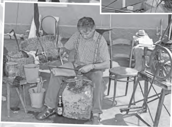
Die Präsentation von historischem Handwerk und Landwirtschaft waren vom Festgelände nicht wegzudenken