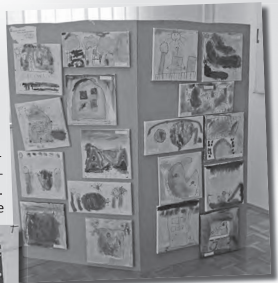
Die gemeinschaftlichen Werke der Bärenkinder des Kindergartens St. Michael...