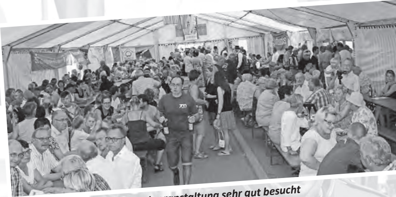
An beiden Tagen war die Festveranstaltung sehr gut besucht