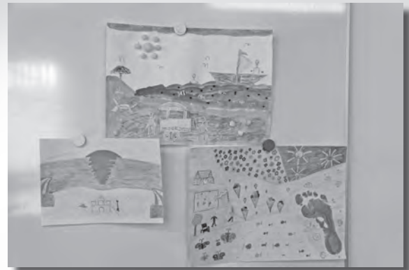
Die Siegerbilder der jeweiligen Altersgruppen