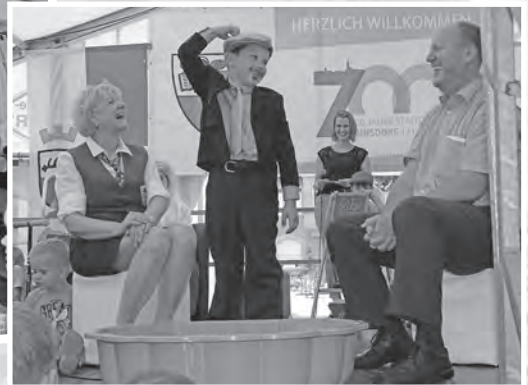
Kindergarten, Grundschule und weitere Gruppen boten eine bunte Unterhaltung