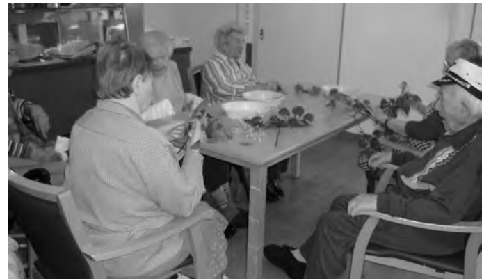
Beim Bearbeiten der Lindenblüten