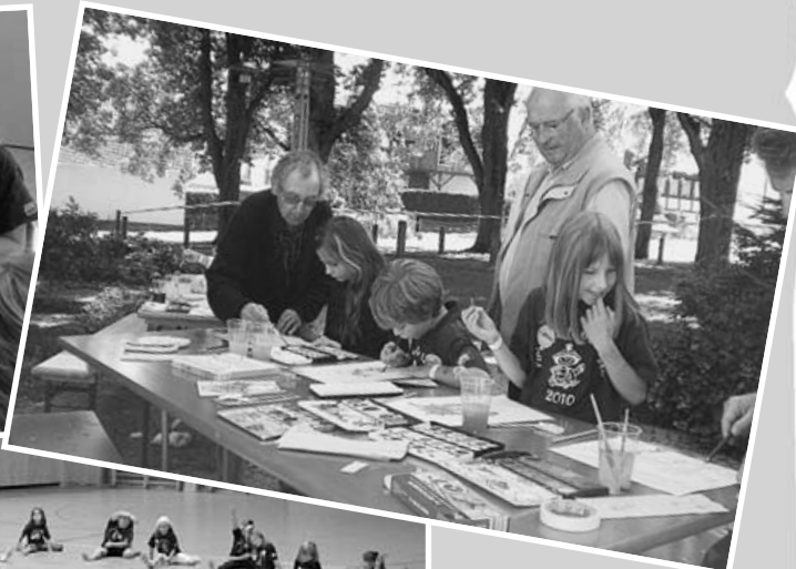
Tag der Vereine