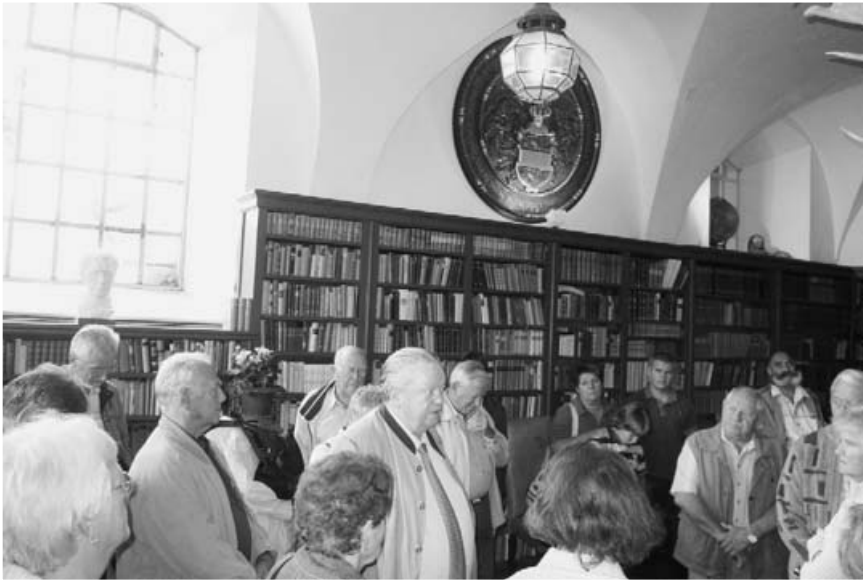
Während der Führung in den verschiedenen Räumen des Hauses.