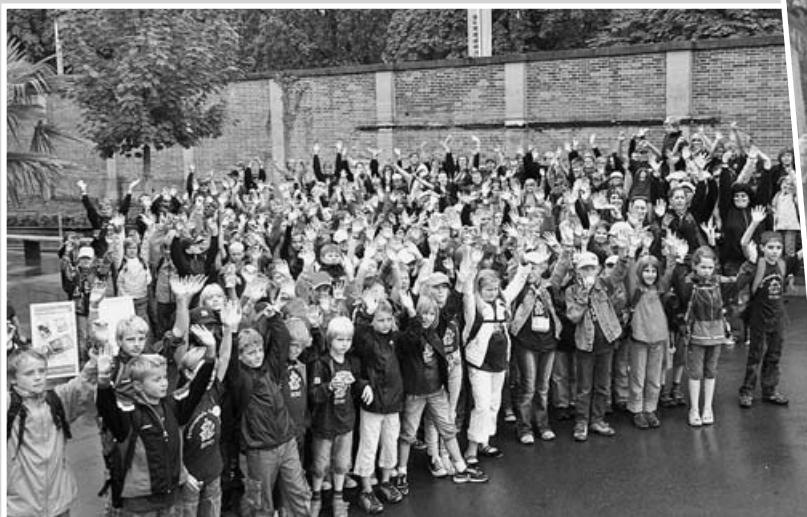
Ausflug mit dem Bürgermeister in die Wilhelma