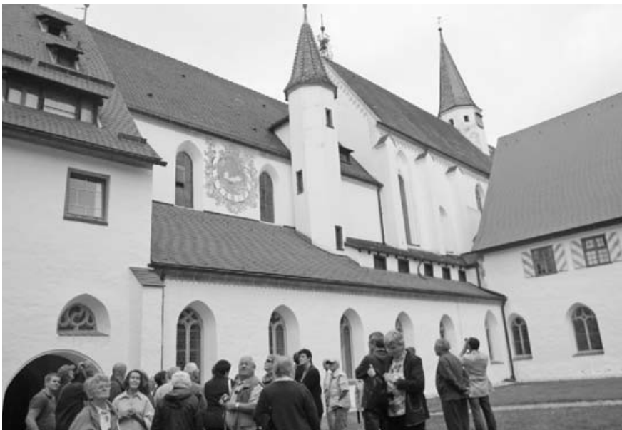
Die Geislinger erlebten auch in der Klosteranlage Heiligkreuztal eine beeindruckende Führung.

Jahrhunderten bis in die Gegenwart berühren. Die Geislinger Reisegruppe wurde angeregt, diese Anlage bei einem privaten Besuch noch näher kennenzulernen.