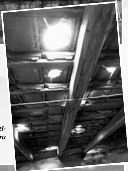
Ebenso gingen zahlreiche Dachziegel zu Bruch genauso...