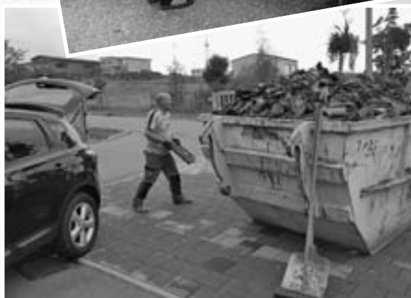
...und dem Gelände des städtischen Bauhofes in Geislingen wurden Container zur kostenlosen Entsorgung der kaputten Dachziegel für die Bürgerinnen und Bürger aufgestellt.