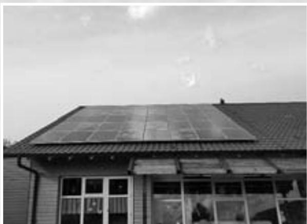
Die Photovoltaikanlage auf dem Dach der Kindertagesstätte Regenbogen in Binsdorf wurde beschädigt