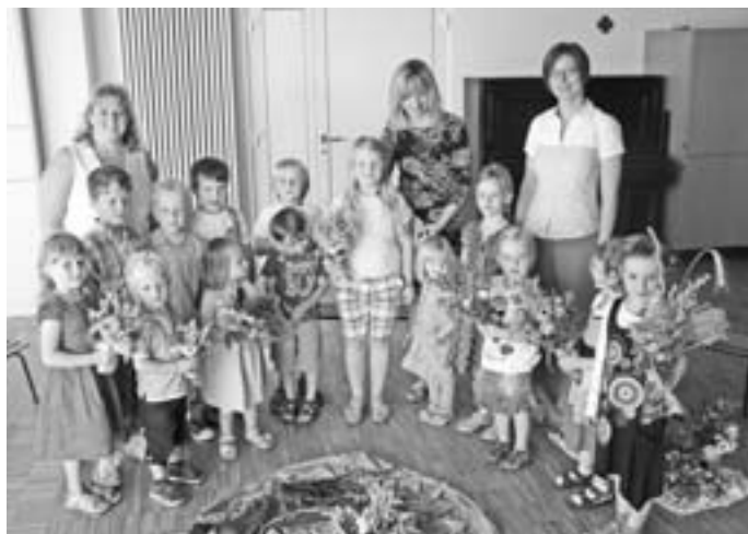
„Alle Kinder die hier sind, grüßten dich Maria. Tanzten, sangen dir ein Lied, grüßten dich Maria.“