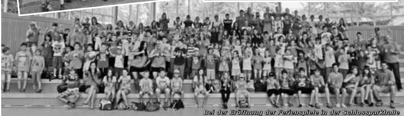
Bei der Eröffnung der Ferienspiele in der Schlossparkhalle